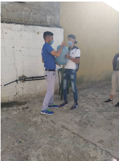
Registros y despachos