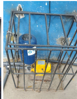
Tanques de agua y bombas alimentadoras