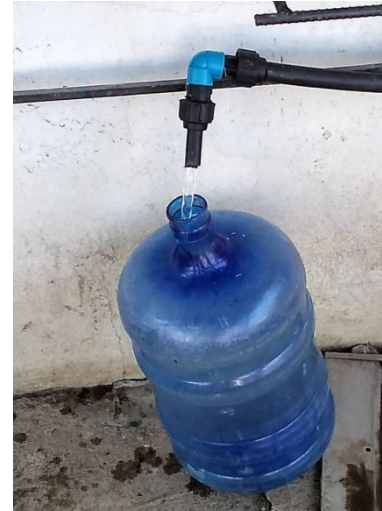
Llenado de botellones